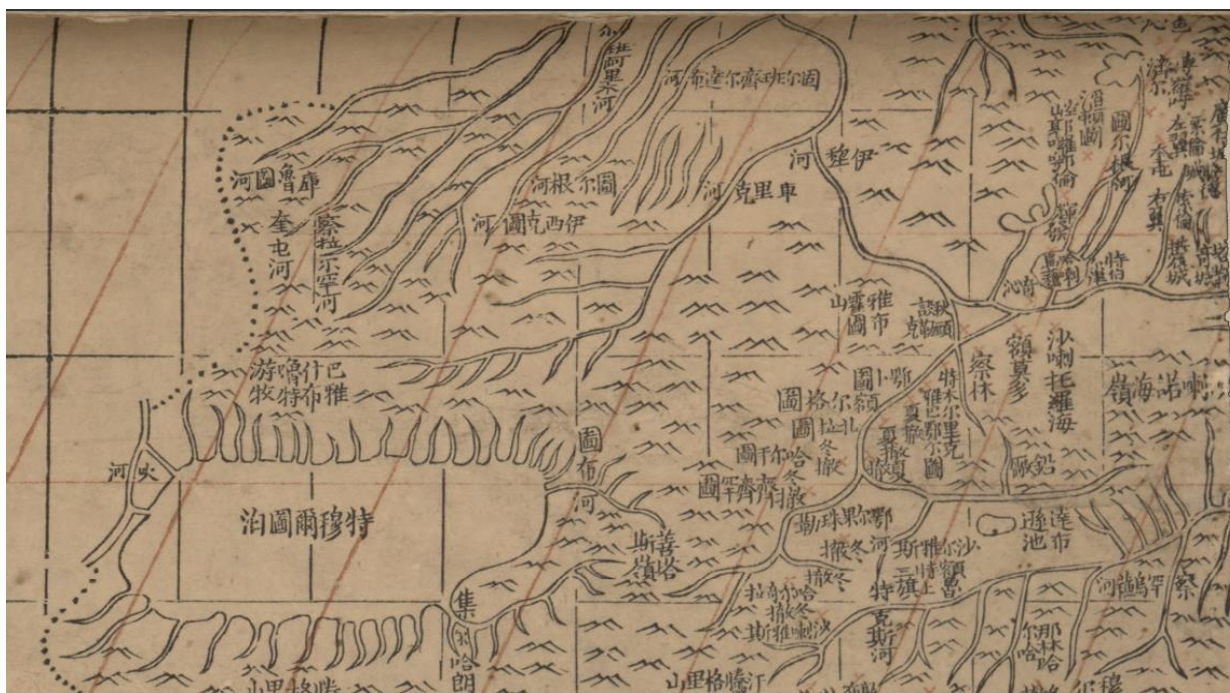
Сурет 4. «Патшалықтың толық картасы» деген картаның бір бөлігі

Аталған карта мазмұны жоғарыда айтылған карталарда жоқ мазмұндарды толықтырған. Ішінара жер атаулары жоғарыда аталған картадағы кейбір жер атауларын анықтауға мүмкіндік бере алады.