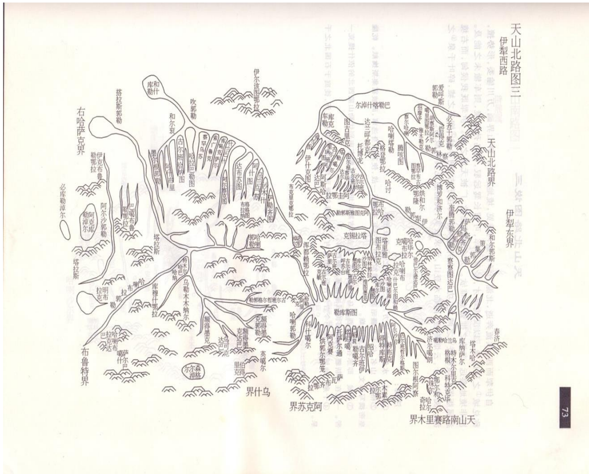
Сурет 3. Еңбектегі Тянь-Шанның солтүстігі № 3-карта, Іленің батысы деген бөлігі

Картаның осы бөлігінде Шонжының нақты орны сол маңдағы жерлермен қоса көрсетілген. Еңбек мазмұнындағы жер-су аттарына қатысты жазған сипаттамалық жазбада «Шонжы» туралы мынадай нақты жазба мәліметті берген: