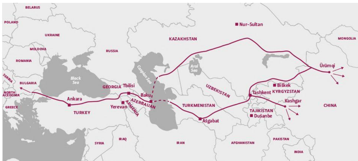
2-сурет. Орта дәліз (www.fiaa.fi, 02.07.2024)

Орталық Азия - Еуроатлантикалық аймақтың қауіпсіздігі мен тұрақтылығы үшін стратегиялық аймақ. Оның энергетикалық ресурстары жаһандық энергетикалық қауіпсіздік үшін өте маңызды және ол газ бен мұнай құбырларының, сондай-ақ сауда дәліздерінің негізгі торабы (www.mfa.gov.tr, 21.08.2024). Түркия энергетикалық жобалардағы серіктестіктерден, соның ішінде құбырларды игеру мен барлау жұмыстарынан пайда көре алады. Сонымен қатар, күн және жел энергетикасы сияқты жаңартылатын энергия көздері жобалары ынтымақтастық мүмкіндіктерін ұсынады.